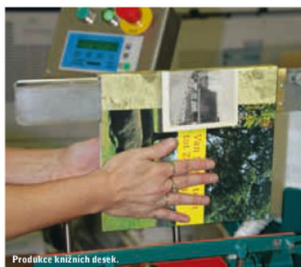
Produkcce knižních desek.

Jádrum celého projektu je především zařízení italské společnosti Meccanotecnica Universe Sewing, které umí sešít jednotlivé archy stejně kvalitně jako klasické dokončovací technologie. A to v maximálním formátu archu 420 x 640 mm, v nákladu od 10 kusů až po desítky tisíc kusů knižních bloků. Což do nedávna bylo pro mnohé nerealizovatelná zakázka. Pojďte však od začátku. Kromě nabídky kooperace vazby V4 a V8 používá Tigris pro oblast vlastního