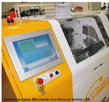
Unikátní instalace Meccanotecnica Universe Sewing v ČR.

Přístup: To, co dříve bylo z pohledu produkce nemožné, se stává skutečností.