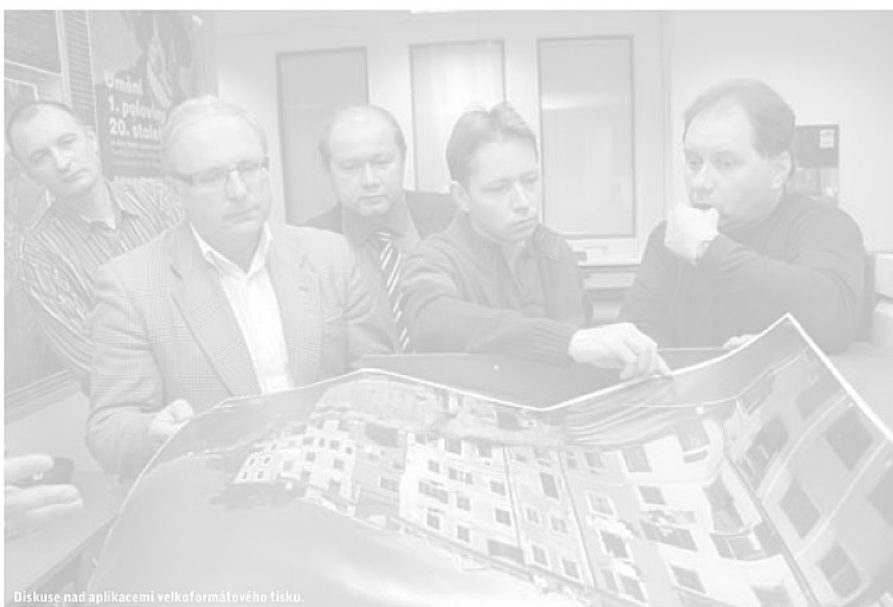
Diskuse nad aplikacemi velkoformátového tisku.

Mezi nosné pilíře akce patřily samozřejmě v oblasti barevného tisku samotné aplikace ve spojení s konkrétním spotřebním materiálem. Právě zde probíhala diskuse obsahující různé praktické poznatky ze strany návštěvníků akce a postupně se tak odkrývaly zcela nové možnosti uplatnění ve spojení s malonákladovým tiskem a s přístupem k samotnému trhu.